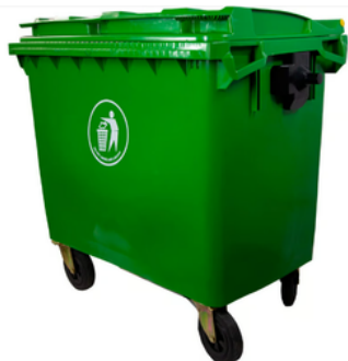
CONTENEDOR 1.100 LITROS