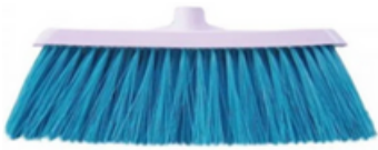
ESCOBA DURA ECO