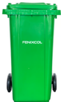
CONTENEDOR 120 LITROS